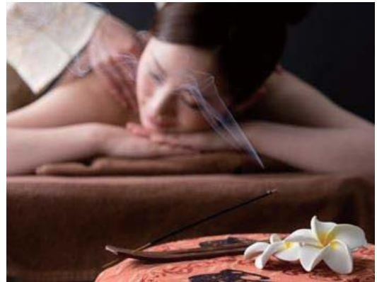
日本製の化粧品のみを使った癒しを体験