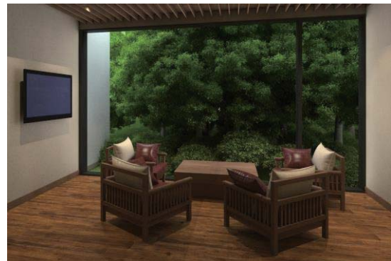
豊かな自然をのぞむスパのロビー