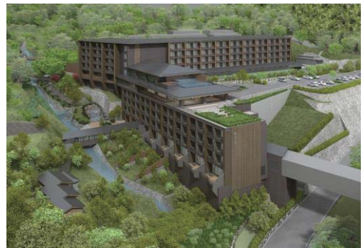
左下の渓谷庭園にある「離れ」がすべてスパになる

「自然と和のおもてなし」をコンセプトにした温泉旅館「箱根小涌園 天悠」は、全室に、箱根ならではの眺望が楽しめる温泉露天風呂がついています。都心からわずか2時間で、春は桜、梅雨はアジサイ、秋は紅葉、冬は雪と、季節ごとに変化する箱根の情景を楽しむことができます。渓谷庭園で行なう朝ヨガや、千条の滝と浅間山をめぐるハイキングなど、箱根の自然を全身で体感できるアクティビティもあり、豊かな箱根時間を過ごしながらか癒されるホテルです。「天悠」の風情ある通路で渓谷を渡り、庭園内に静かにたたずむ離れが、『庵 SPA HAKONE』です。