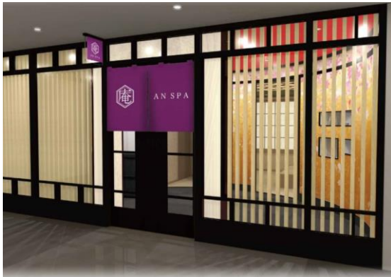
『庵 SPA グランドニッコー東京台場店』 エントランス

『庵 SPA』では、フェイシャルケアにはミキモトコスメティックス、ボディケアには資生堂 Qi 製品を使っています。また、トリートメントには日本式の指圧も取り入れ、日本ならではの繊細な施術とサービスを提供しています。今治タオルや信楽焼の茶器ほか、調度品や小物類もすべて日本の上質な製品で揃え、セラピストの制服も着物をイメージしたものにするなど、徹底して「和」にこだわりました。施術は、当社が全国 5 カ所で運営しているエステティックスクール『クレドセラピストス