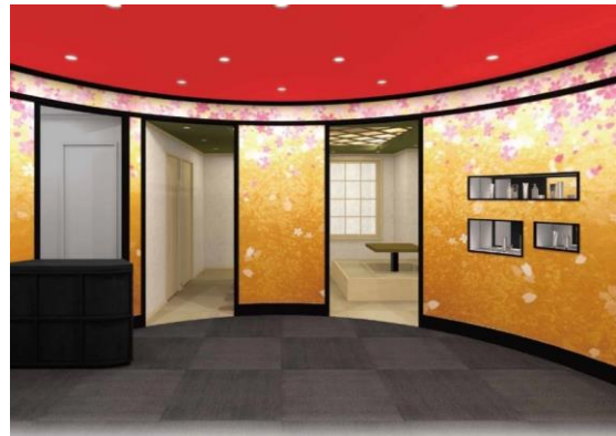
一步入ると、琉球畳や掘りごたつがお出迎え（イメージ）