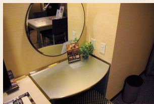
客室内に設置された告知用のPOPは、クレドインターナショナルが設置するのでホテル側の金銭的負担は一切ない

その中で出会ったのが、クレドインターナショナルの提供するインルームスパサービスだった。「実はこのサービスは、グループホテルの渋谷東急インですでに導入済みでした。実績もあったので当ホテルでもスムーズに契約へと話が進み、今年10月からサービスを開始しました。導入後のお客さまの反応はとてもよいですね。当日予約が可能で、お客さまがスパを受けたいと思ったときに申し込みできます。スパの予約時間に合わせて仕事や食事の時間を調整する必要がないこと、営業時間