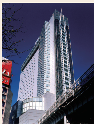
渋谷駅直結の渋谷エクセルホテル東急

【お問い合わせ】 株式会社 クレドインターナショナル 〒104-0061 東京都中央区銀座6-7-18 デイト銀座ビル7階 ☎03-3569-7701 サービス提供エリア=日本全国および台湾、タイ、シンガポール、香港、韓国 http://www.cred-in.com 台湾支社 台湾台北市中山區中山北路二段170號8樓 ☎+886-2-2567-9847