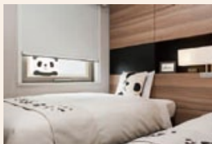
ファミリーに人気のパンダルーム

【お問い合わせ】 株式会社クレドインター ナショナル 〒104-0061 東京都中央区銀座6-7-18 ダイム銀座ビル7階 薬03-3569-7701 サービス提供エリア=全国展開中 http://www.cred-in.com