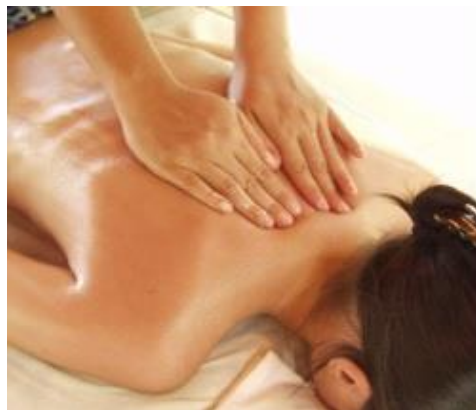
「週〇時間以上」のルールなし、完全自由出勤